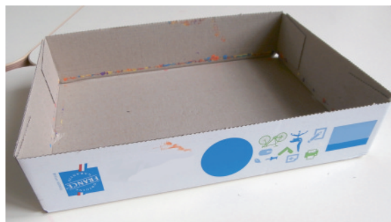
un carton avec des rebords