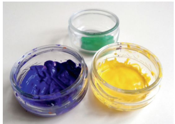
des pots de peinture