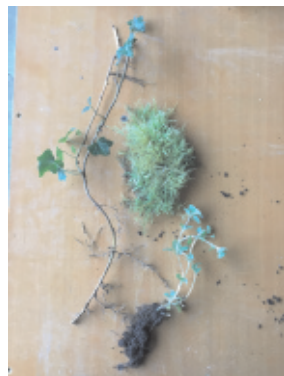
Des plantes avec leurs racines