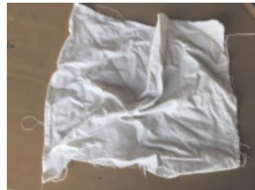
Un morceau de tissu