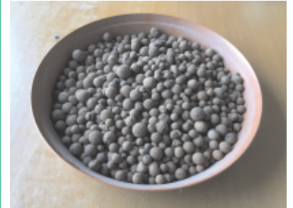
Des billes d'argile ou du gravier