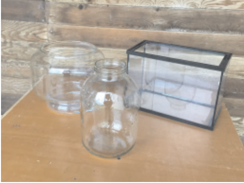
Un bocal en verre ou un terrarium