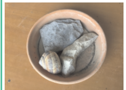
Des éléments décoratifs