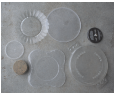
Un couvercle adapté au bocal