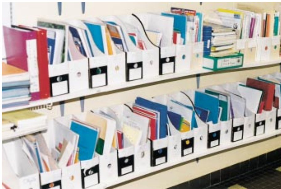
Dans la classe, les places sont libres car, cahiers personnels, livrets d'évaluation et travaux en cours sont rangés dans des boîtes personnelles.