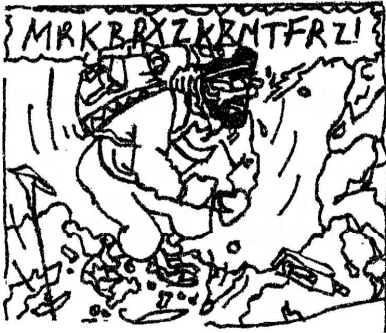
Parler français comme une vache espagnole (parler très mal)