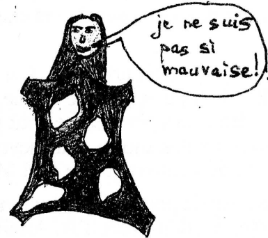
Une peau de vache (une personne méchante)