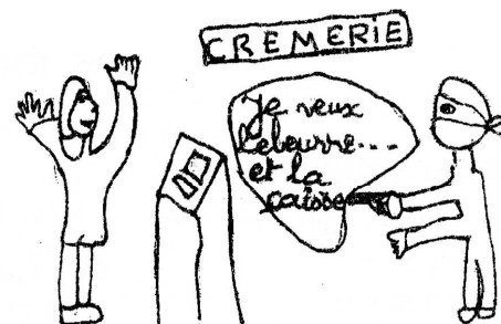
Vouloir le beurre et l'argent du beurre (réclamer tout sans rien donner en échange)