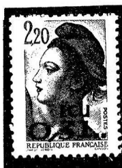
timbre émis en 1988

timbre «Liberté de Gandon» -2,20 F-, rouge surchargé « ECU 0,31..»