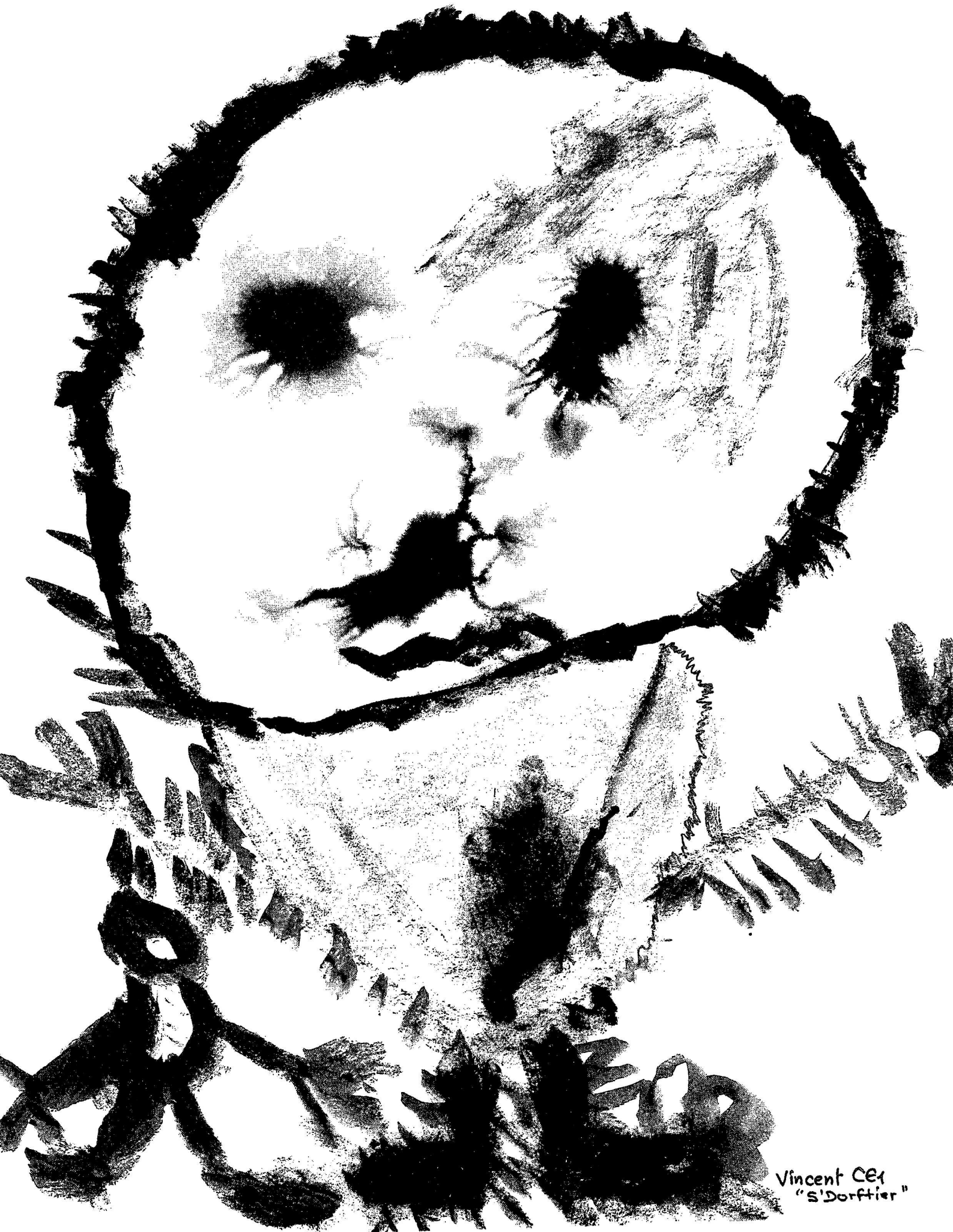
Vincent CE1 "S'Dorffier"