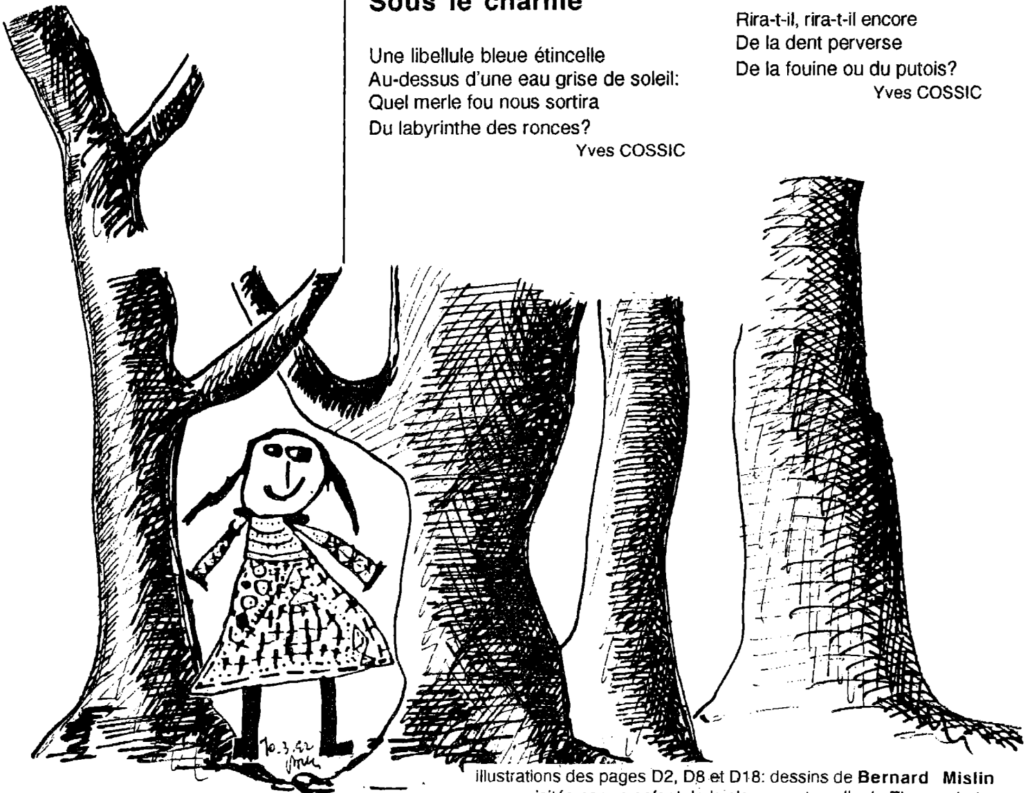
illustrations des pages D2, D8 et D18: dessins de Bernard Mislin visités par un enfant de la classe maternelle de Zimmersheim

Une libellule bleue étincelle Au-dessus d'une eau grise de soleil: Quel merle fou nous sortira Du labyrinthe des ronces? Yves COSSIC