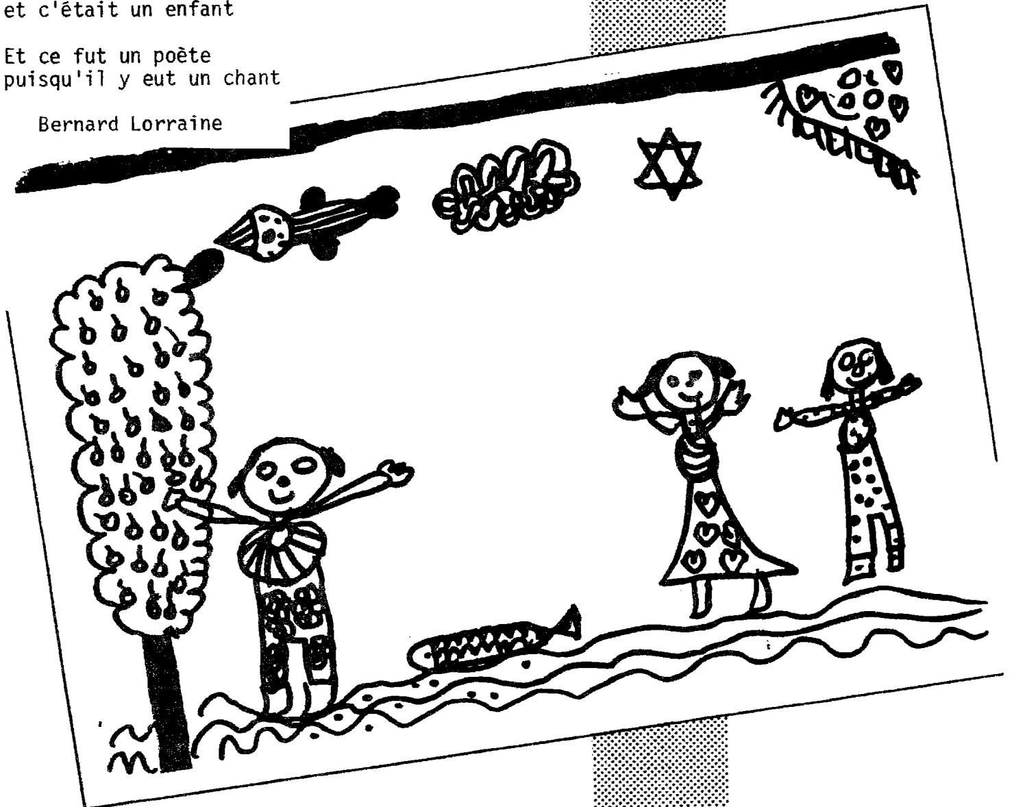
illustration d'Audrey (classe de M.Gerner)