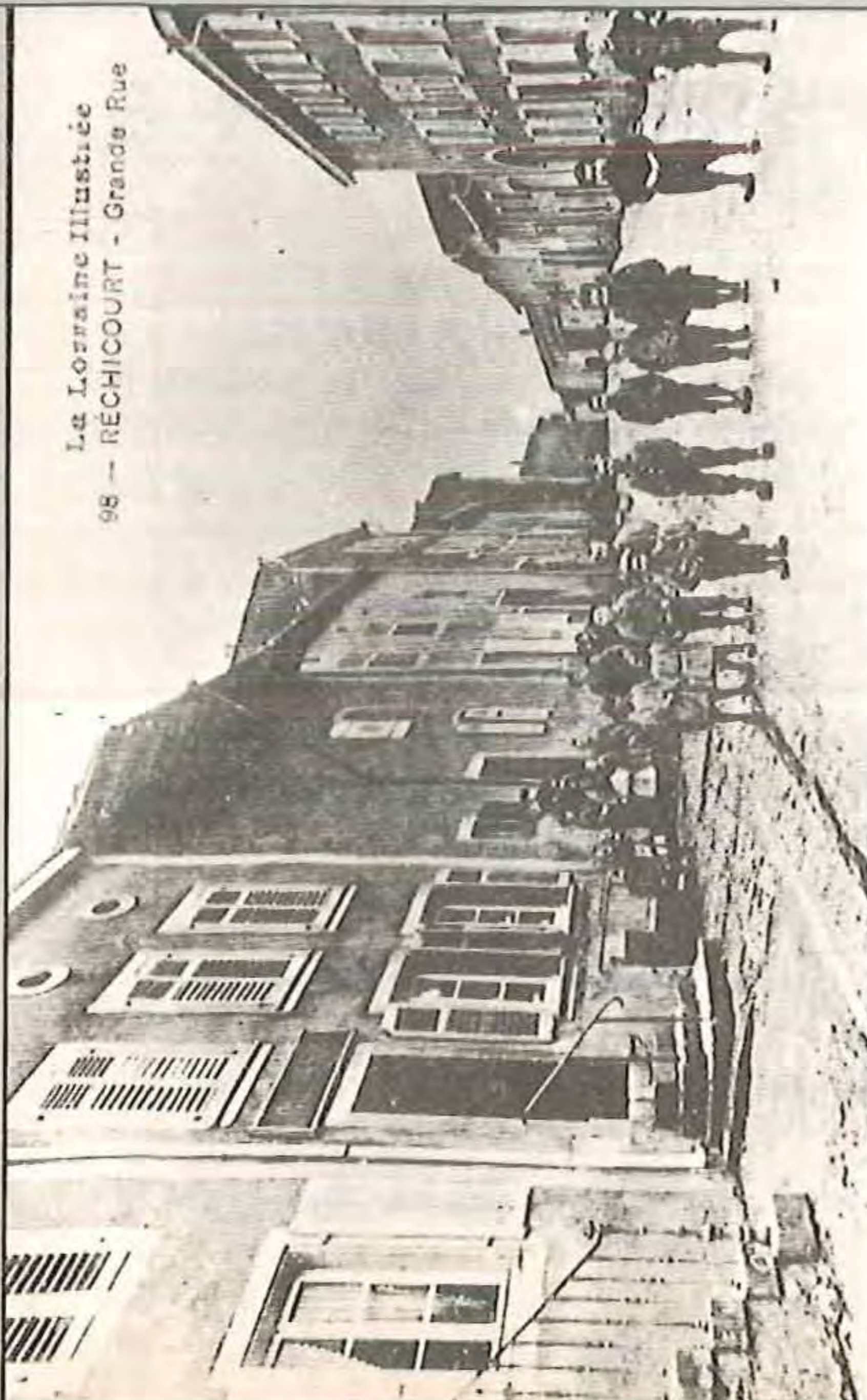
Réchicourt (Moselle) en 1910