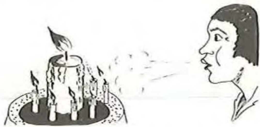
16 ans : une grosse bougie et six petites bougies.