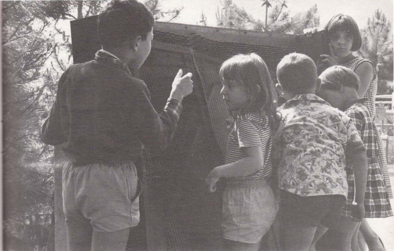
Le dos d'un vieux piano