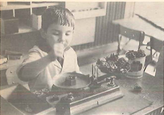
Coin épicerie n° 12