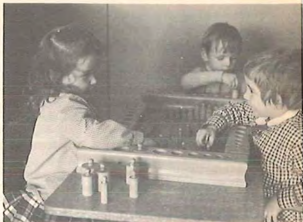
Les emboitements n° 10 Les jeux avec l'eau n° 6